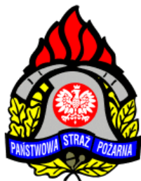
Poste de Pompiers de l'Arrondissement de Chrzanów